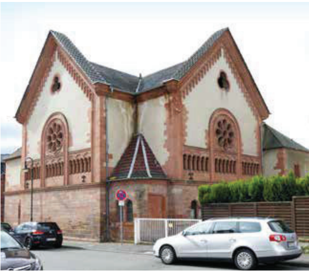
Synagoge in Schlüchtern, Main-Kinzig-Kreis, erbaut 1898. Eines der wenigen erhaltenen Beispiele einer prächtigen Synagoge in einer hessischen Kleinstadt.

kontinuierlich vornehmen zu können. Derzeit wird an dem Projekt mit Hochdruck gearbeitet. Das ehrgeizige Ziel ist die Freischaltung der Hauptartikel zu 300 Synagogen bis Anfang 2022.