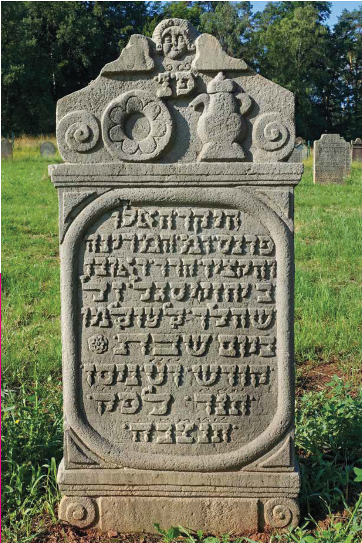
Grabstein für Ruben Levi aus Neumorschen auf dem Jüdischen Friedhof in Binsförth, Schwalm-Eder-Kreis, mit Levitenkanne und Schale.